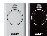
Diverse toebehoren Pagina 198