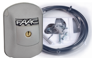
Ontgrendelingsmechanisme inclusief kabel en cylinderslot XK21L 24V