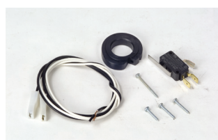
Kit eindeloop schakelaar (open of dicht)**